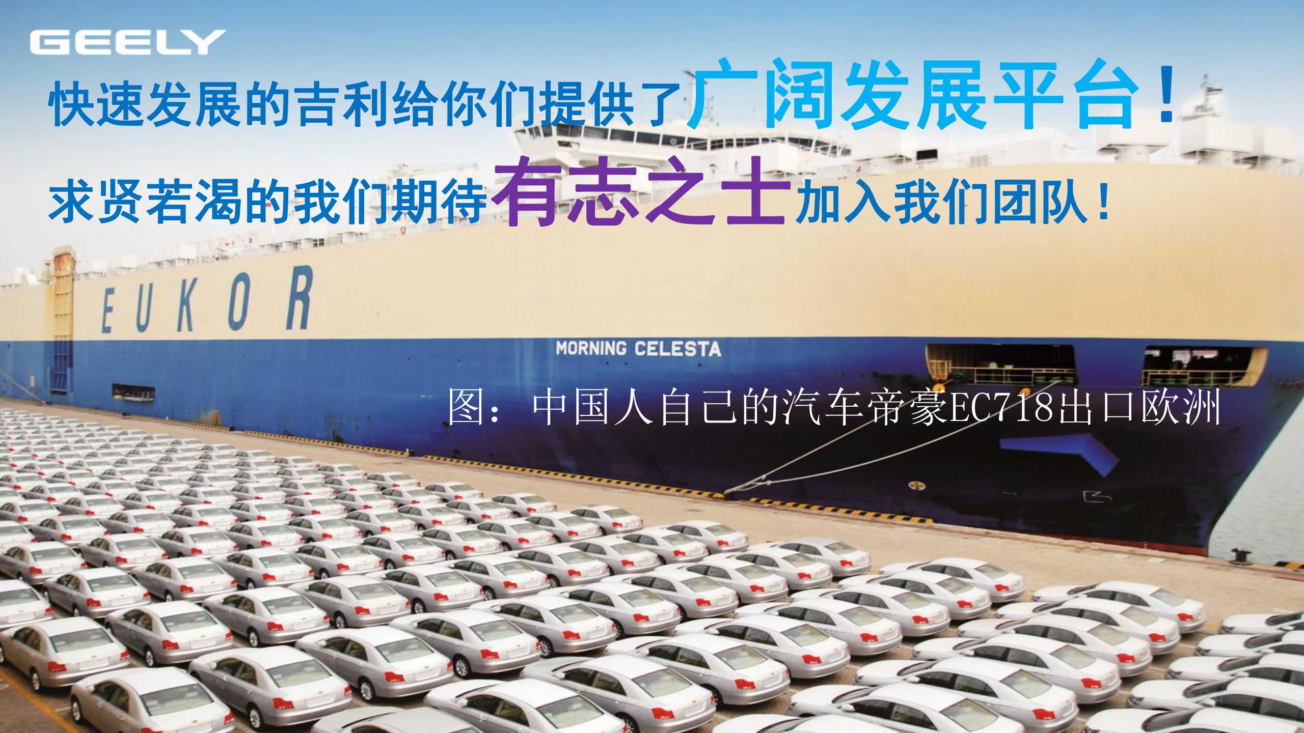
图：中国人自己的汽车帝豪EC718出口欧洲